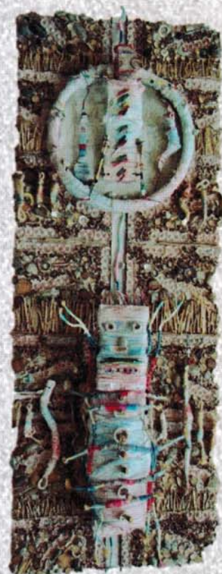
藤原 向意氏 作品